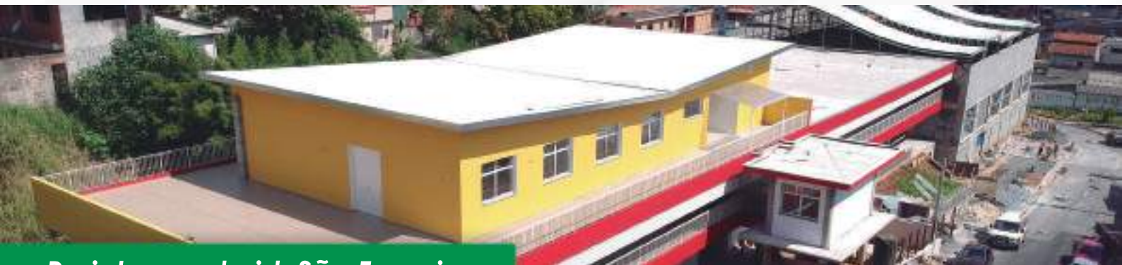
Projeto escola jd. São Francisco