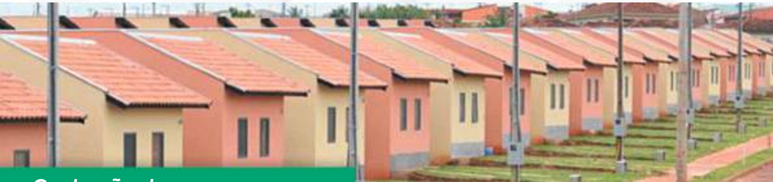
Construção de novas casas