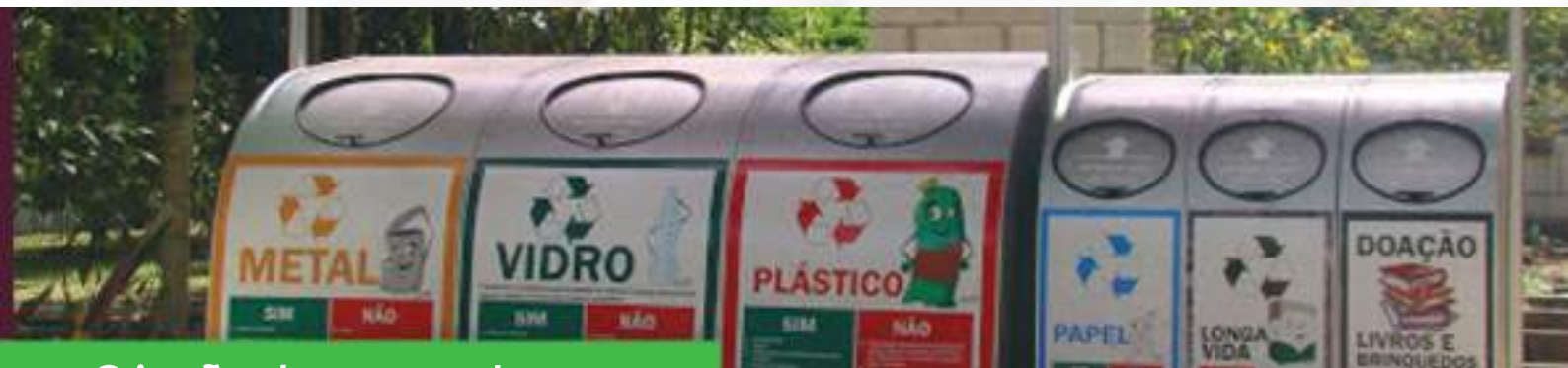
Criação de eco pontos