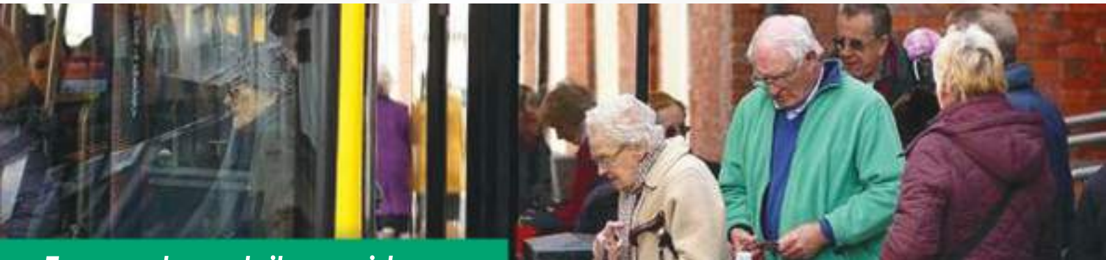
Transporte gratuito aos idosos