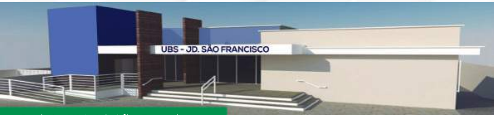
Projeto UBS Jd. São Francisco