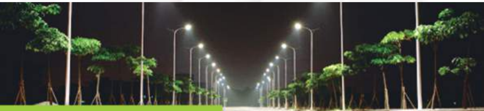
Iluminação de LED